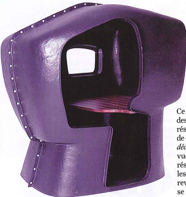
Un refuge urbain en polyester et bois exotique, Skull, fabriqué sur mesure par l'Atelier Van Lieshout ( www.designdecollection.fr ).

... Croisements. En réaction à un trop-plein de stimuli et à un stress permanent, on recherche des objets capables de nous apporter plus de silence, de ressourcement. »