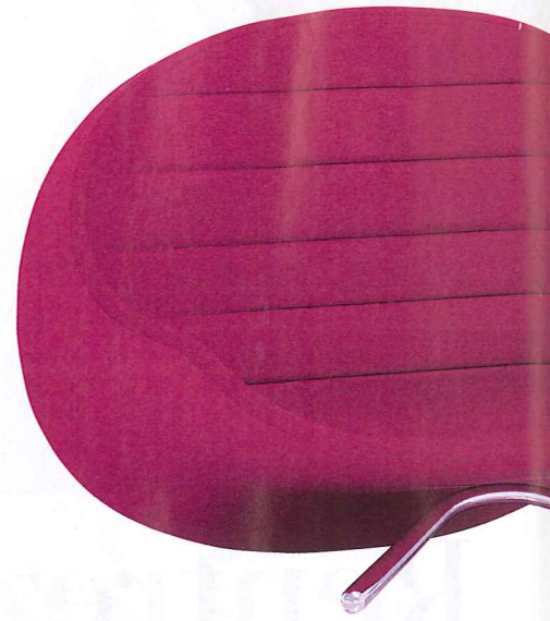
Avec son grand miroir dans le dos, ce sofa permet de se cacher derrière le reflet du monde extérieur. Sofa Double Je du R'Pure Studio ( www.rpure.net ).